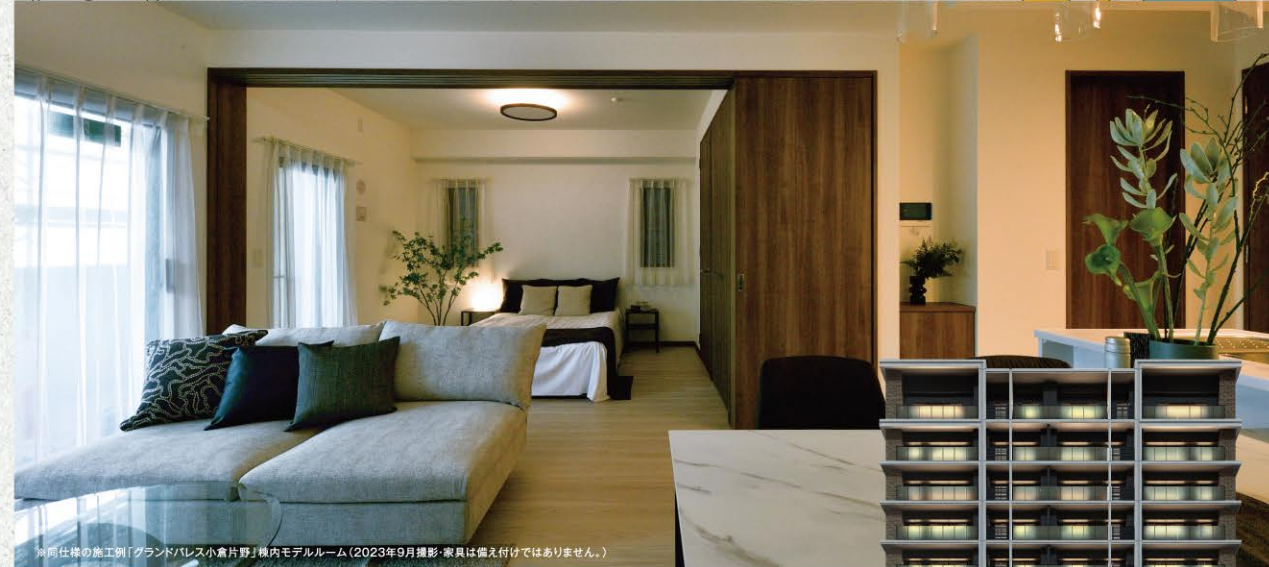
※同仕様の施工例「Grandパレス小倉片野」機内モデルルーム(2023年9月撮影・家具は備え付けではありません。)

「Grandパレス城野タワー」& どちらも「Grandパレス下津」 2LDKラスト1邸 実物見学会開催!