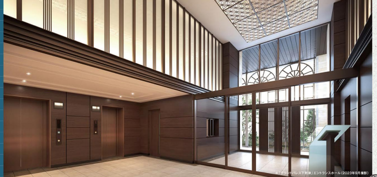
「Grandパレス下津」エントランスホール(2023年9月撮影)